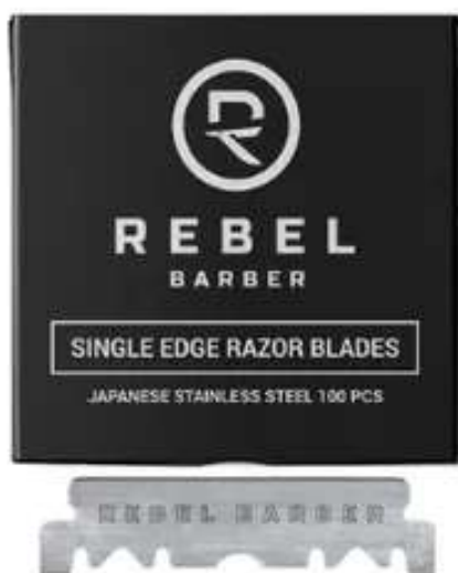
Сменные лезвия для опасных бритв REBEL BARBER Single Blade