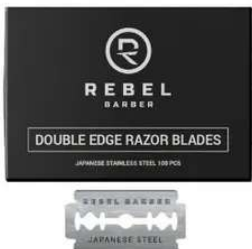
Классические сменные лезвия Rebel Barber