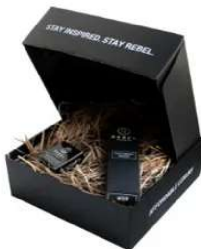
Подарочный набор REBEL BARBER Predator Black & Blades