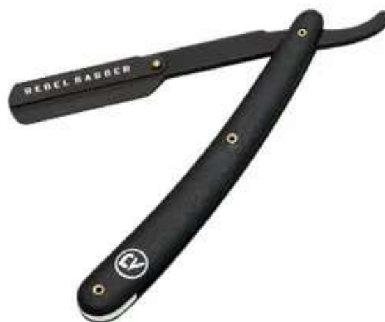
Опасная бритва со сменным лезвием REBEL BARBER Professional Black